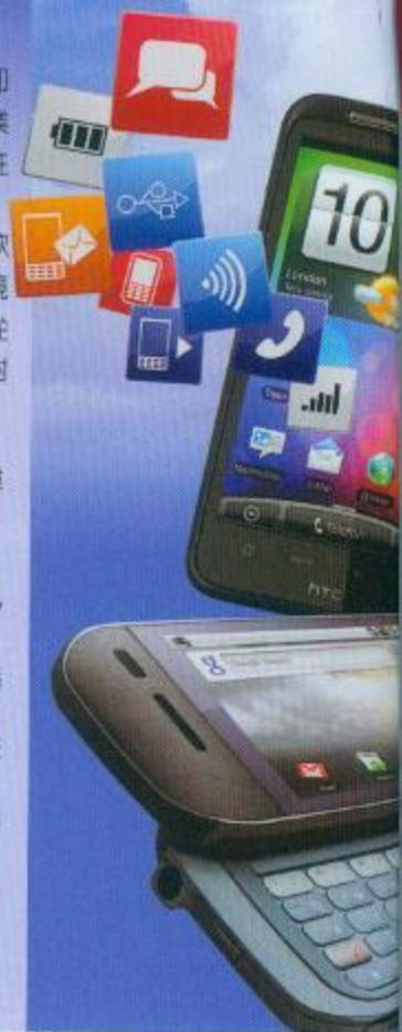
封面、目錄圖片來源：蘋果、宏達電、榮金