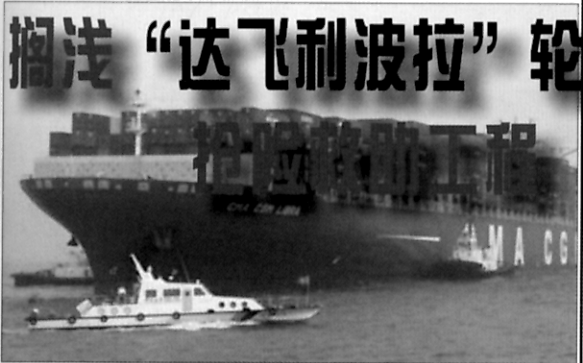
“航海技术”搁浅“达飞”轮抢险救助工程—见第49页