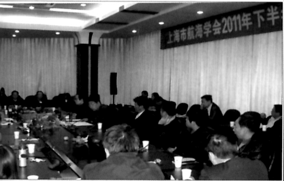
学会召开2011年第二次联络员工作会议—见第45页