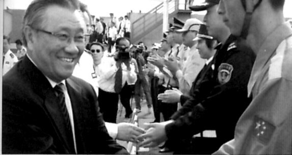
“约见航海界”海上应急突发事件处理及案例分析—见第6页