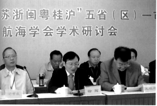
“学会之窗”“苏浙闽粤桂沪”航运人研讨创新与发展-见第42页