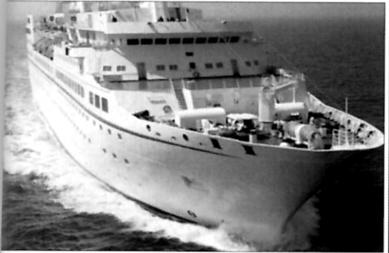
“航海技术”浅谈进出巴西PDM港航行安全-见第54页