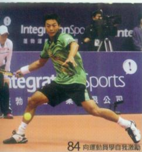
84 向運動員學自我激勵