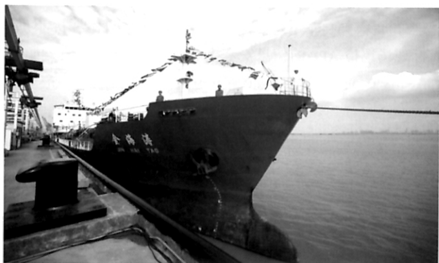
约见航海界 上海中远海运举行中海化运交接仪式