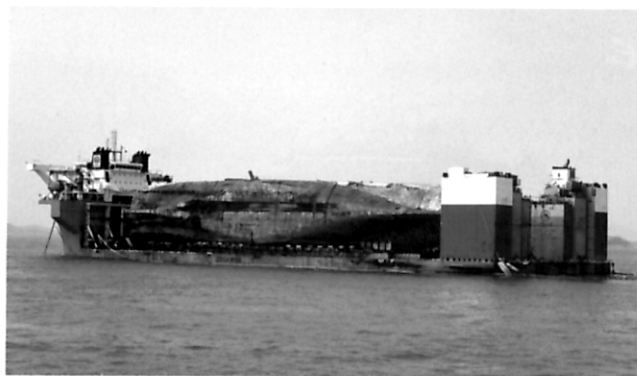
图片新闻 韩国“世越”号重见天日