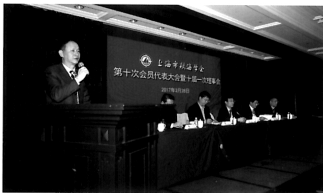
约见航海界 市航海学会第十次会员代表大会隆重举行