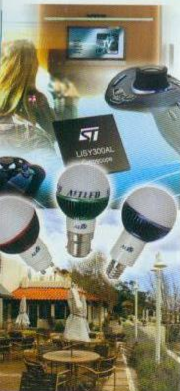
圖中左起：無法半導體、鴻海