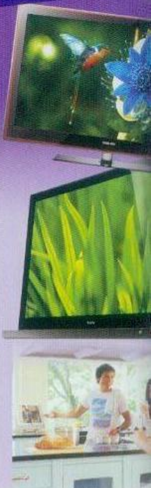
11頁、10頁圖片來源，均經一三電、